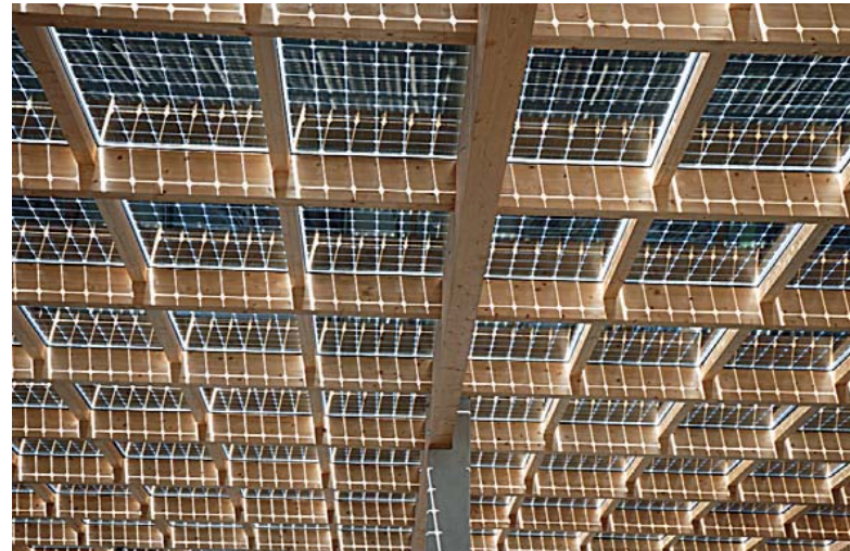
Module PV Products GmbH