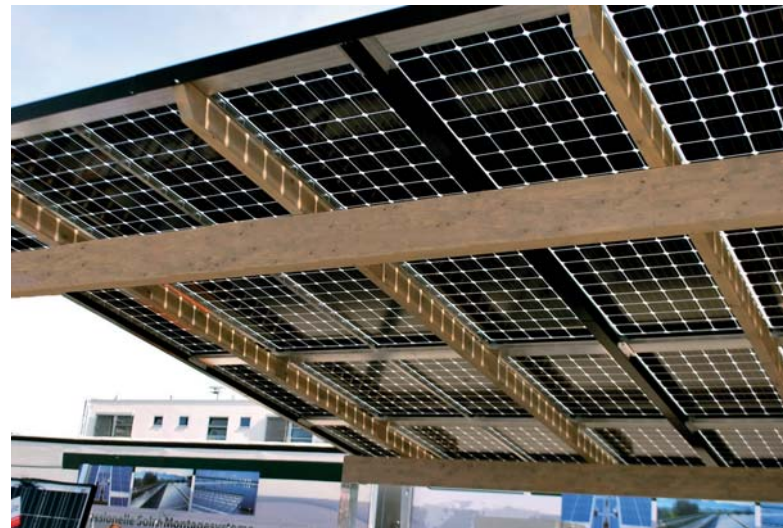
SI Module