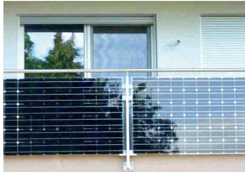
Module PV Products GmbH