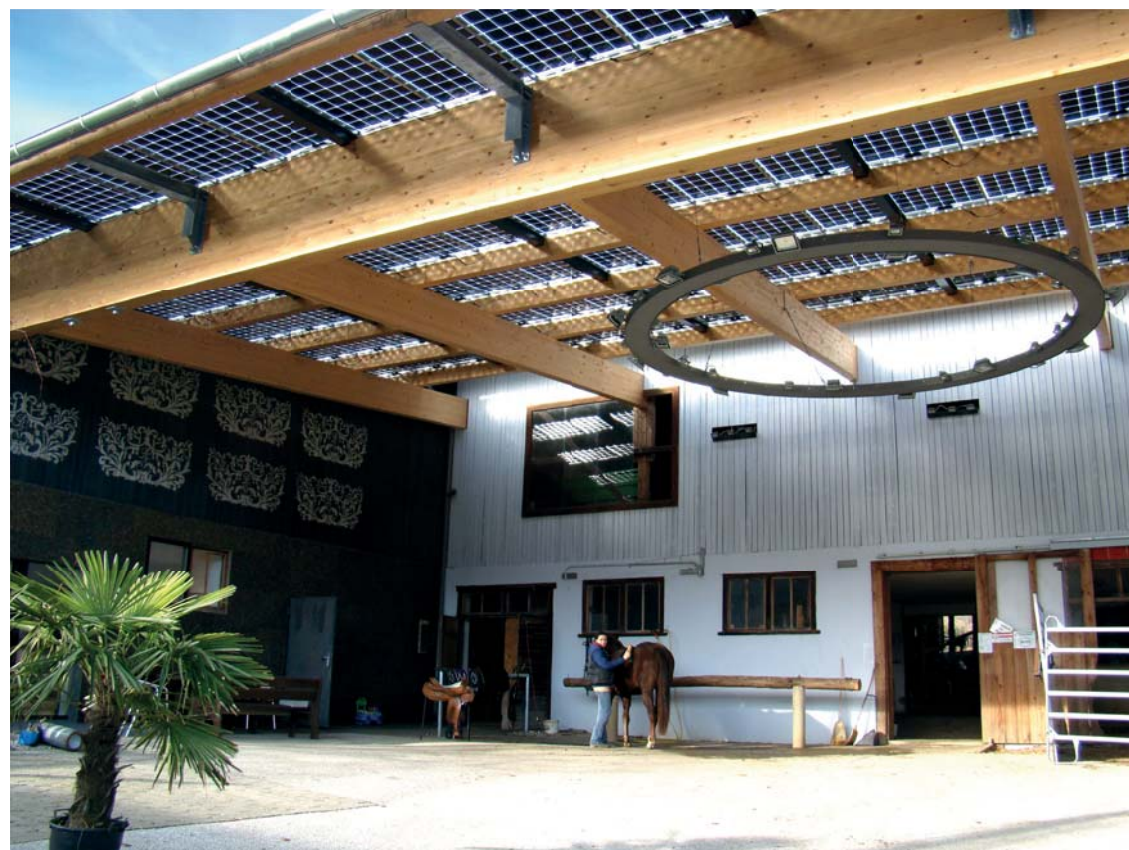
SI Module / Reitcenter Windisch Österreich