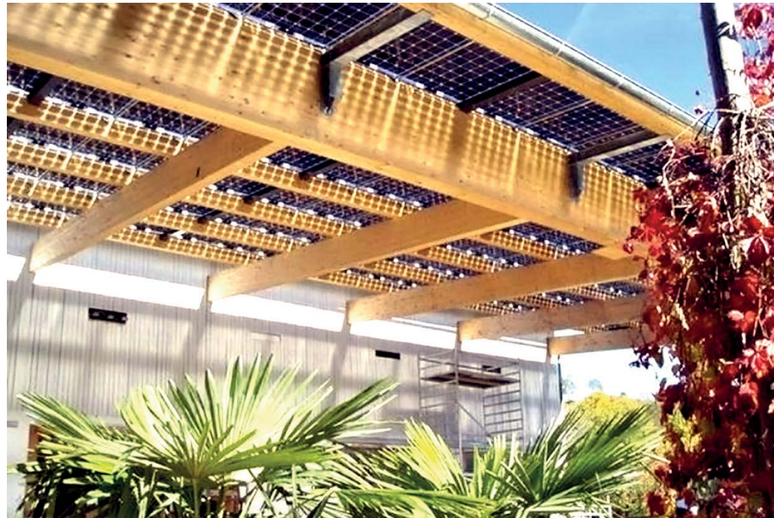
SI Module / Reitcenter Windisch Österreich